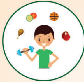
बच्चे में अच्छी आदतों का विकास करना