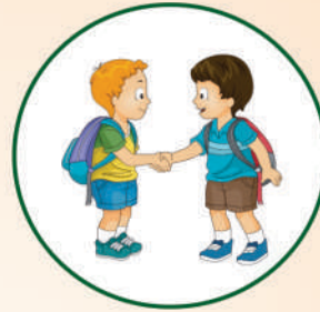
सामाजिक व्यवहार विकसित करना