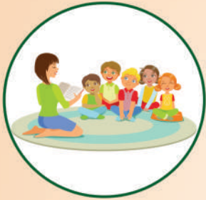
बुनियादी ज्ञान का विकास