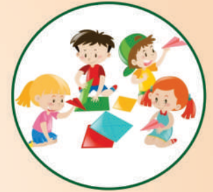
आयु और विकास के अनुरूप शिक्षा